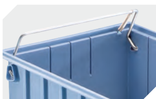
Sicherungs-/Tragebügel für Regalkästen RK und C-Teile-Be- hälter CTB 3-31314