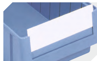
Schutzfolien für Regalkästen RK L 115 x B 40 mm 3-22681