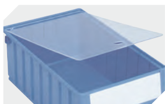
Staubdeckel für Regalkästen RK L 365 x B 146 mm 3-30201