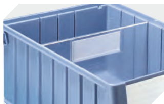
Querteiler für Regalkästen RK 3-22676